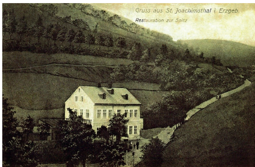
Restaurace „Na Špici“

V nejhořejší části Jáchymova byl dům zvaný „Nadlerhäusel“. Název souvisel s živností rodiny, která provozovala