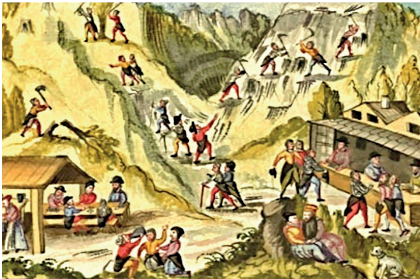
V Údolí vznikly hospody, i když pivo i víno bylo nutné ještě dovážet.

V sedmnáctém století začala zuřit třicetiletá válka a jáchymovské hospody zely prázdnotou. Sloužily většinou pouze jako místo pro shromáždění obyvatel, když je bylo nutné svolat. Naopak se hospody vytvářely ve vojenských leženích, které musel Jáchymov zásobovat pivem a chlebem. A to i v případech, že se armáda utábořila v Ostrově, v Hroznětíně nebo v ještě vzdálenější lokalitě.