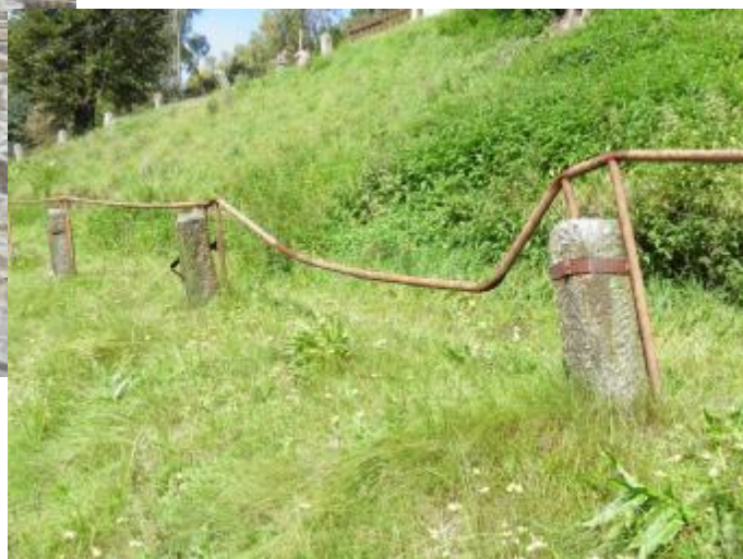
Nelíba – cestička nad Unionem