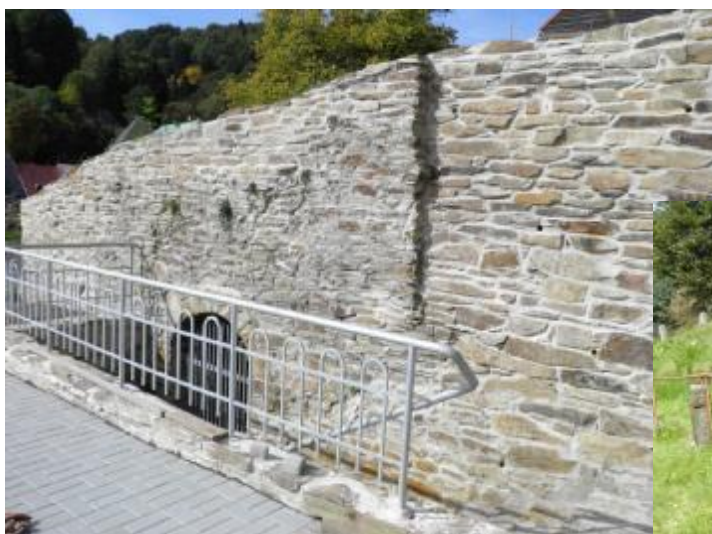
Líba – Šafaříkova ulice